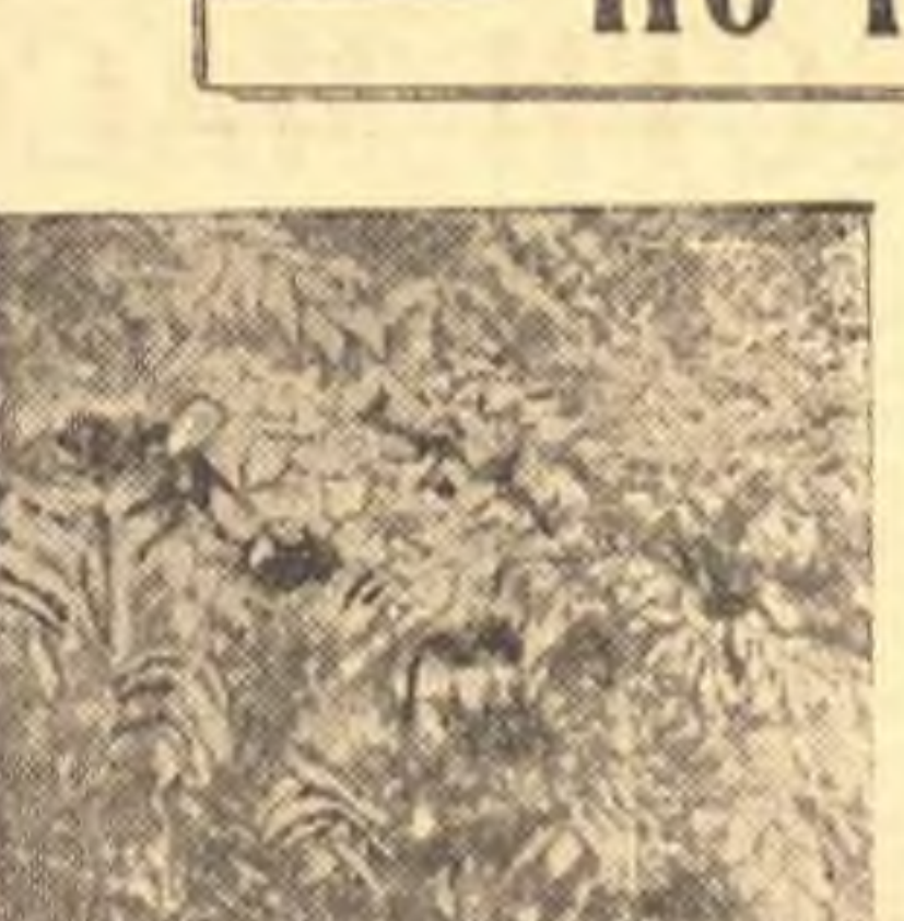
В ботаническом саду университета 12 лет растет и хорошо переносит сибирские морозы стройное дерево смачжурский ореха. В этом году оно впервые дало 30 плодов. В овале плоды манжурского ореха.