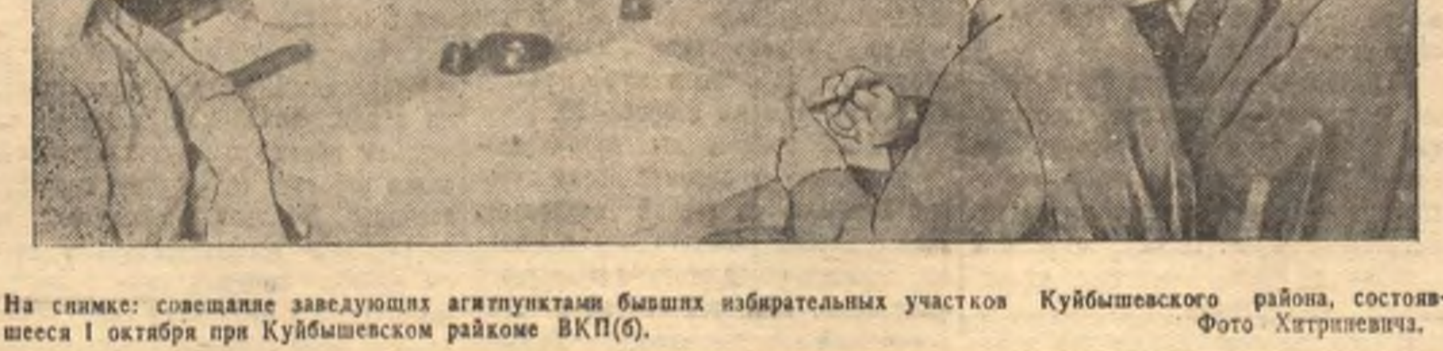
На снимке: совещание заведующих агитпунктами бывших избирательных участков Куйбышевского района, состоявшееся 1 октября при Куйбышевском райкоме ВКП(б).

Учат историю ВКП(б), русский язык и политическую географию. По вопросам партийного строительства намечается провести 10 семинаров.