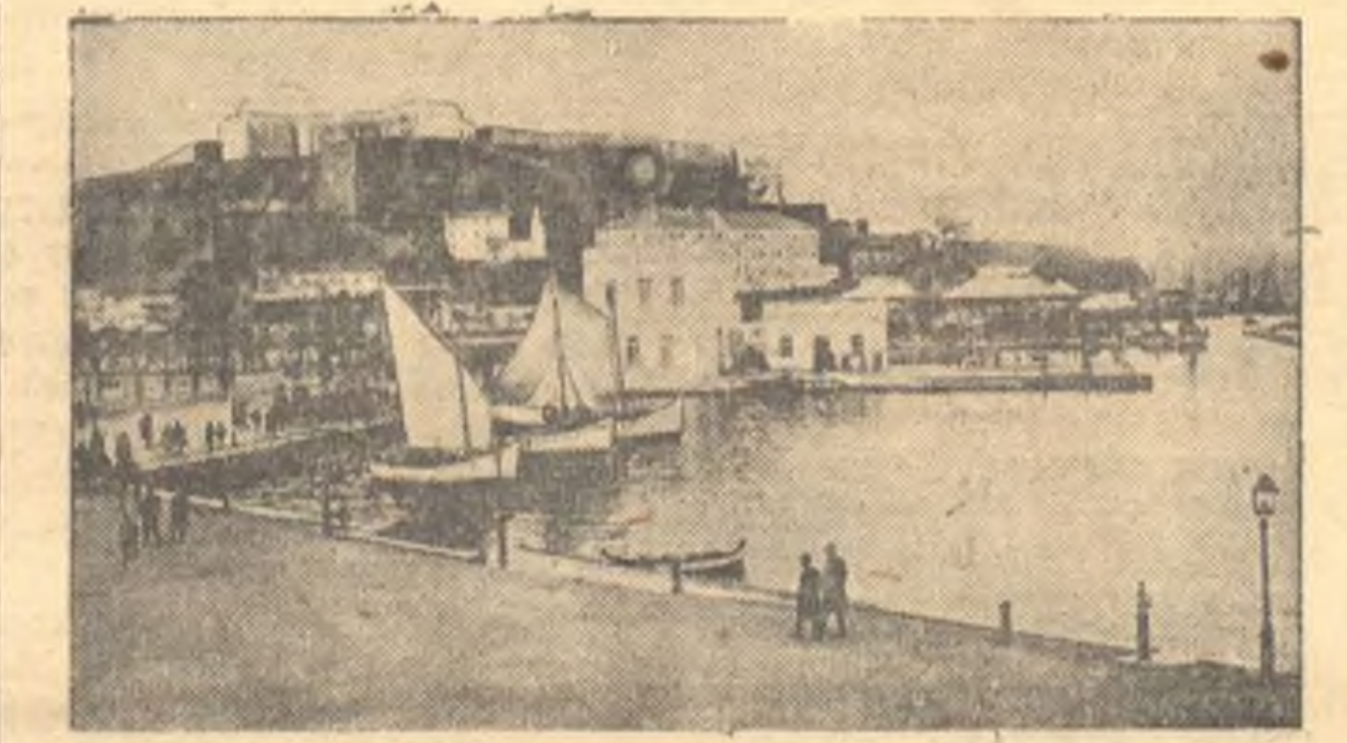
Война между Италией и Грецией. На снимке: греческий остров Корфу.

ЛОНДОН, 20 ноября. (ТАСС). Агентство Рейтер сообщает, что итальянские самолеты бомбардировали остров Самос на Эгейском море. В операции участвовали итальянские самолеты. Материальный ущерб незначителен.