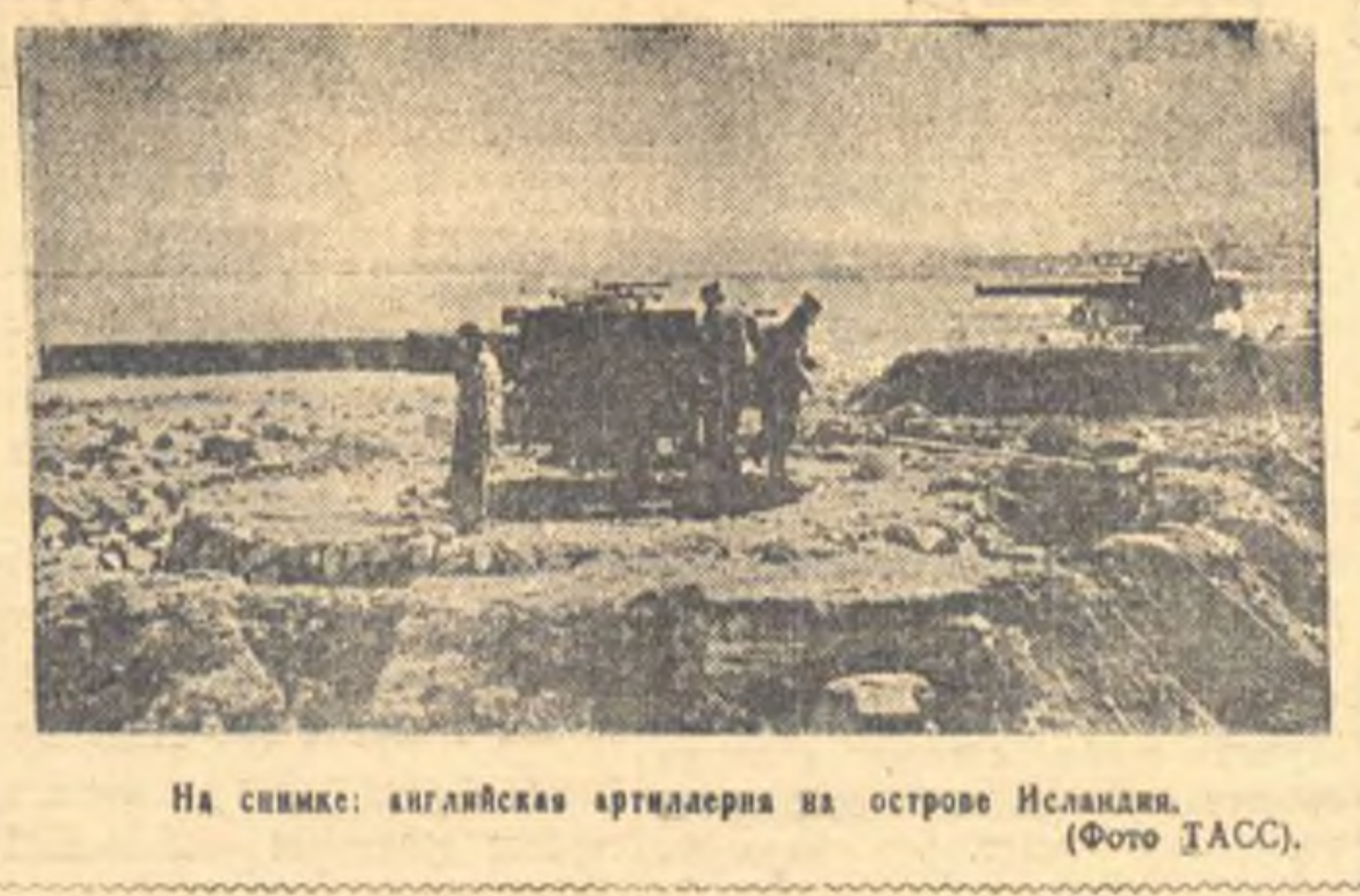
На снимке: английская артиллерия на острове Хельголанд.

ЛОНДОН, 17 декабря. (ТАСС). Рейтер сообщает, что в налете английских военно-воздушных сил на Берлин в ночь на 17 декабря уничтожены 18 миллионов рабочих часов. Операция продолжилась в ночь на 18 декабря. Главными объектами бомбардировки были электростанция, железнодорожные узлы и товарные склады. Во время налета на газель Франкфурта-на-Майне бомбы сброшены на товарные склады, промышленные предприятия, авиаторы и нефтехранилища.