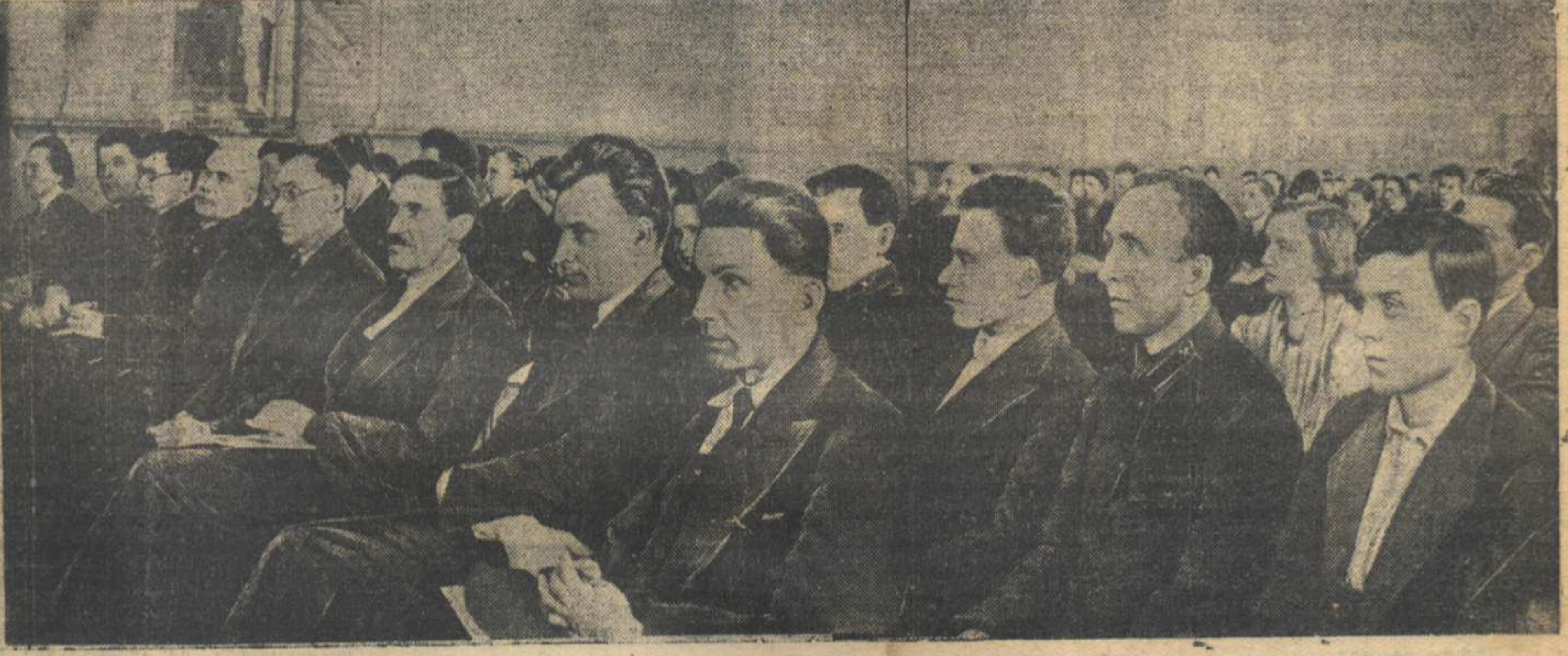
На первом заседании студенческой научно-технической конференции.