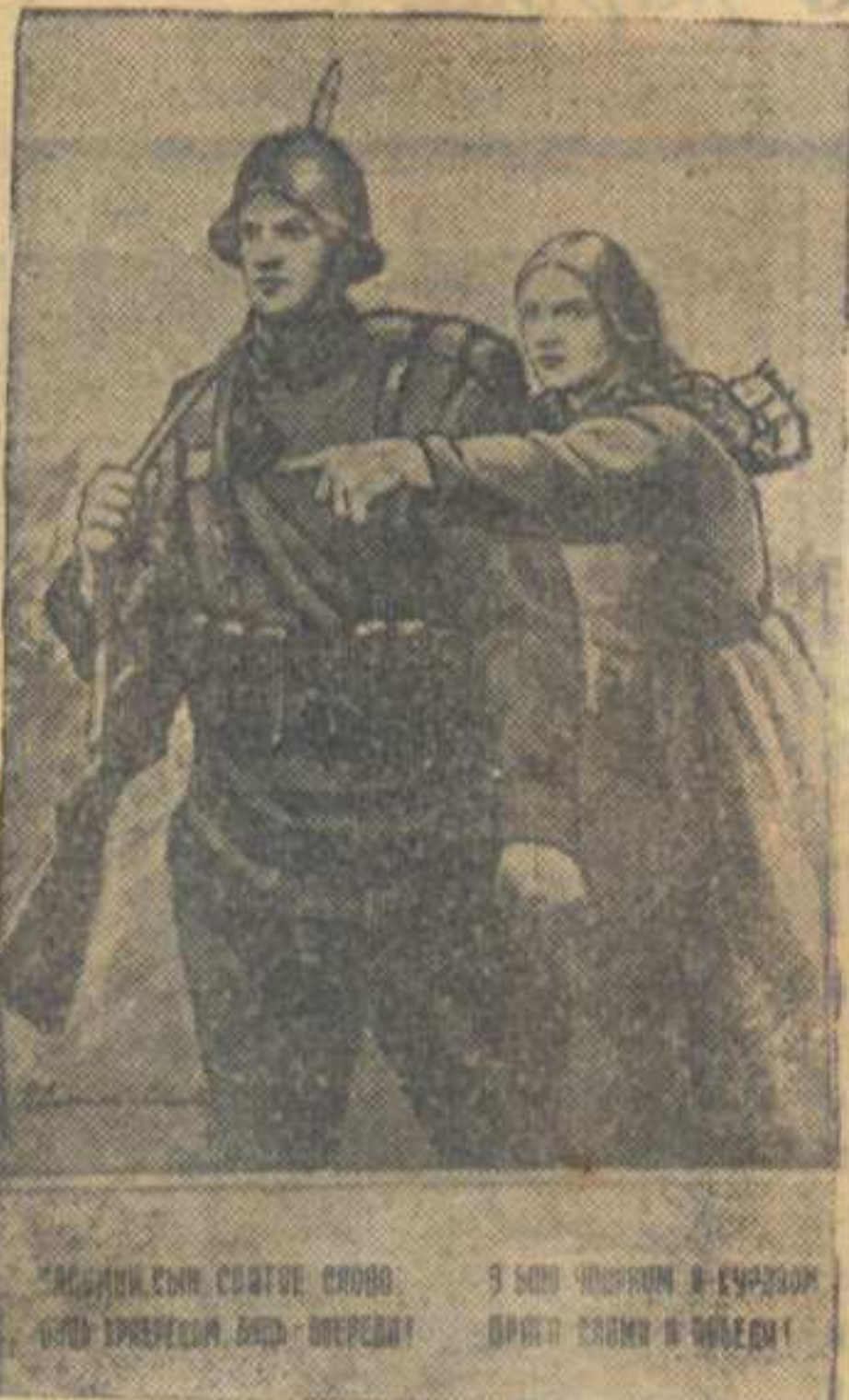
«Наш народ любит мир, ценит его великие блага и борется за мир по всем мирам. Но он умеет и воевать. И не только умеет, но и любит воевать» (Ворошилов). Рисунок П. Соколова-Скляги. («Юно ТАСС»).