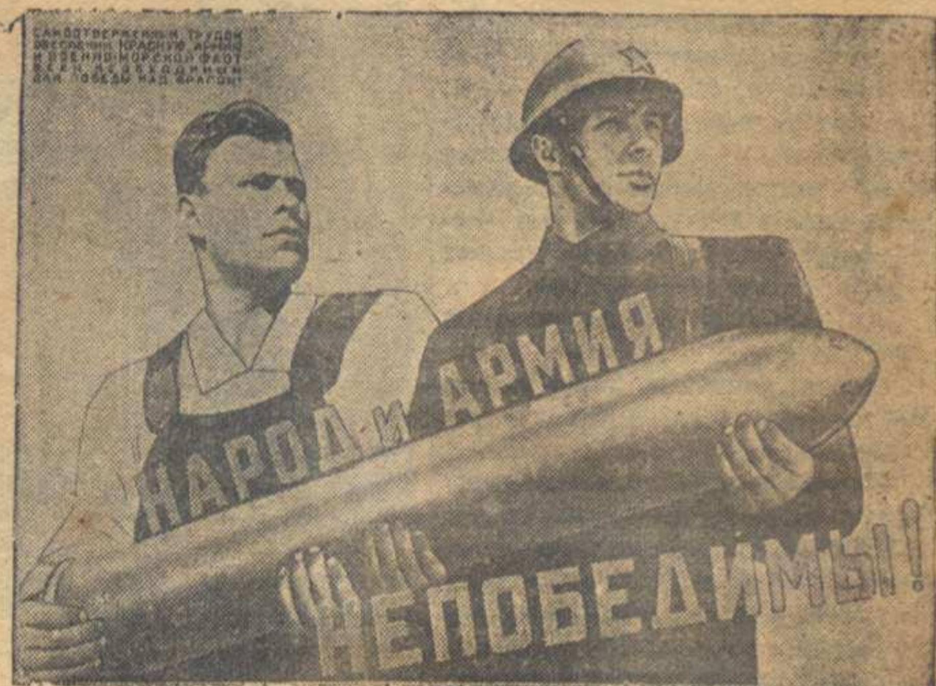
Худ. В. Корепкин. (Репродукция с плаката, выпущенного издательством «Искусство»).