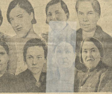
На снимке (в первом ряду, слева направо)... На снимке (в первом ряду, слева направо)...