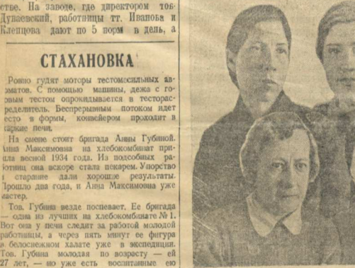
На снимке (в первом ряду, слева направо)... На снимке (в первом ряду, слева направо)...