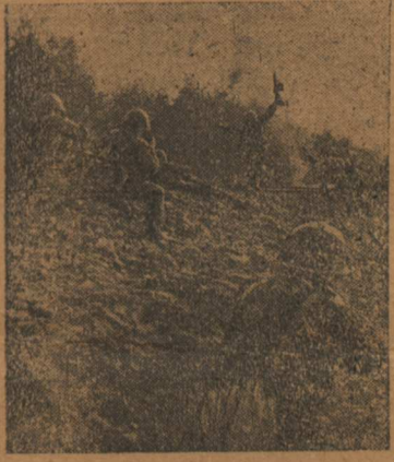
Действующая Армия (Западный фронт). На снимке гвардейцы-автоматчики части, где командиром тов. Кузьмин, обитают у гитлеровцев участок железнодорожной магистрали.

В течение десяти дней несколько партизанских отрядов, действующих в Орловской области, вели ожесточенные бои против немецко-фашистских частей. Оккупанты потеряли в этих боях более 2000 солдат и офицеров. Партизаны сбили 3 немецких самолета, уничтожили 2 бронемашину и захватили трофеи и пленных.