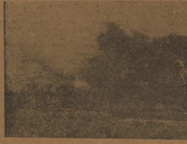
Действующая Армия (Западный фронт). На снимке: гвардейцы-автоматчики Н-ской стрелковой части атакуют фашистов под местечком Н.

Вступив в новый месяц 1942 года — года окончательного разгрома гитлеровских мерзавцев, — стхановцы военного времени берут на себя новые конкретные обязательства. Они обязуются выполнить месячный план за 15—20 дней. Надо возглавить этот замечательный поеди передовых людей и на основе его мобилизовать всех трудящихся на успешное выполнение июньского плана и программы второго квартала.