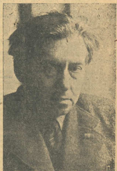
На снимке: Лауреат Сталинской премии писатель Илья Григорьевич Эренбург.