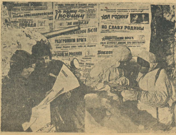
Фотомонтаж художника В. Данилоза. (Фотохроника ТАСС).

Чтоб скорей пришли с победой сыновья в родной свой дом— Подпишитесь на Военный Государственный Заем!