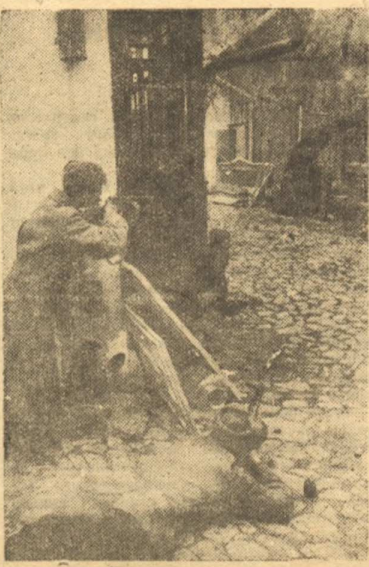
1-й Украинский фронт. На снимке: Уличный бой в населенном пункте.

Солдат 8 немецкой танковой дивизии Пьер Л. сообщил: «Службу в гитлеровской армии я считаю величайшим позором и несчастьем для француза. Французский патриот, на которого насильно напялили немецкий мундир, чувствует себя так, словно его на аркане тащат в пропасть. Еще в пути на фронт мы, эльзасцы, договорились между собой о переходе на сторону русских. Мне скоро представилась такая возможность. Я сдался в плен не для того, чтобы выйти из войны, нет, я перешел на сторону советских войск потому, что хочу участвовать в борьбе с нашим общим врагом — немцами».