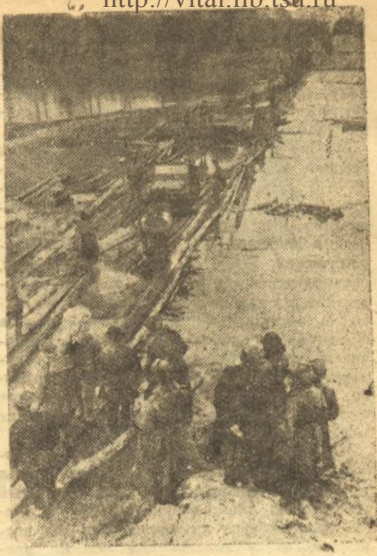
1-й Украинский фронт. На снимке: Переправа советских войск через реку Прут.

Среднеморская авиация союзников произвела 640 самолетовылетов.