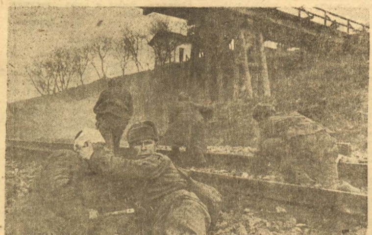
Действующая Армия. Предгорья Карпат. На снимке: Подразделение капитана Шарыгина ведет бой за железнодорожную станцию.