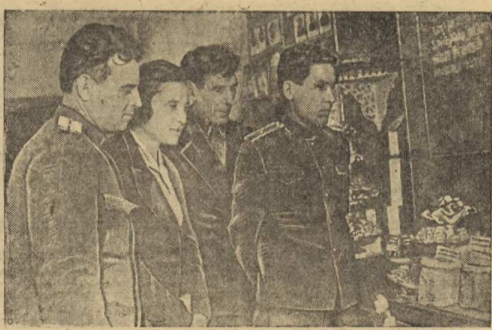
На снимке: группа делегатов областной партийной конференции из Парабельского района...

Томский горком партии провел ряд мероприятий, направленных на улучшение работы первичных комсомольских организаций.