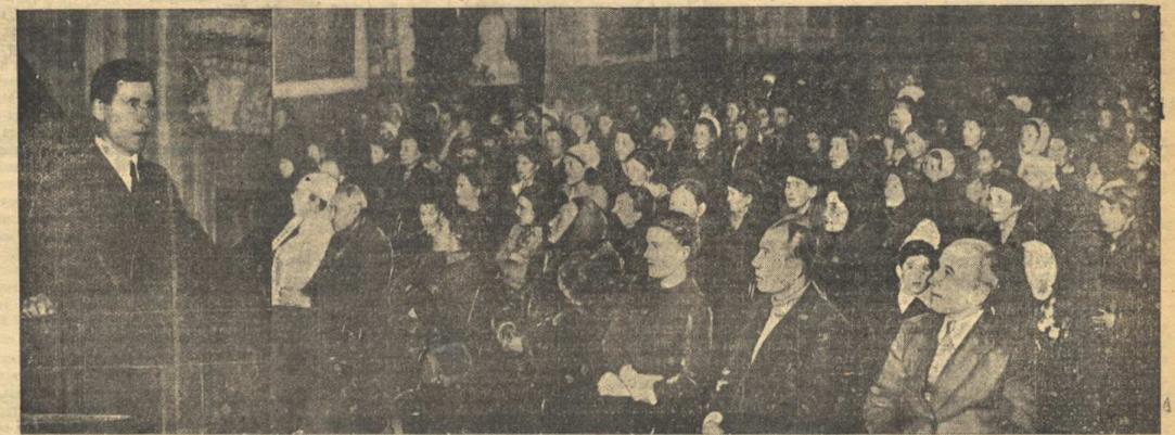
Кандидат в депутаты Совета Союза Верховного Совета СССР академик А. Г. Савинич на встрече со своими избирателями.

Вместе для примера Казахстан — страну, чьи богатейшие производственные силы, чьи национальные организаторские таланты были до революции почти спяли. Только два процента населения были грамотными. На территории Казахстана, где уместно несколько крупных европейских государств, вместе взятых, но было ни одного среднего и высшего учебного заведения. Сейчас в Казахстане сотни средних школ, около 90 техникумов, 22 высших учебных заведения. Биография любого выдвинутого в Казахстане кандидата в депутаты Верховного Совета СССР отражает новую жизнь всего казахского народа. Вот прославленная сталеном молодой казахской нефтяной промышленности Байгалым Достоева. Начиная свой трудовой путь, она была неграмотной. Во обучении грамоте, заботились о шестилетней в темноте, познательные организаторские способности. А способному человеку в нашей стране все пути дороги открыты! Сейчас Достоева — мастер по добыче нефти, руководителем породного участка, записанного по месту в соревнованиях в честь 25-летия Советского Казахстана, ее зовут и уважают все республика. Ни от другой кандидат казахского народа представляется молодой национальный интеллигент. Это изрядно казахизированный Инна Викторовна Петрова. Нетрудно представить, какова была бы судьба этой талантливой девушки, если бы не советская власть, раскрывшая все духовные и материальные силы народа.