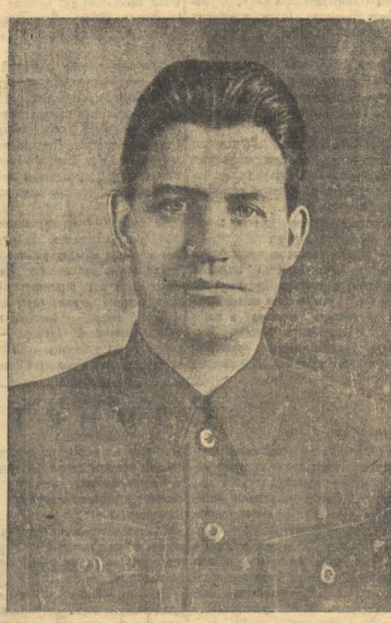
Воспитанник большевистской партии