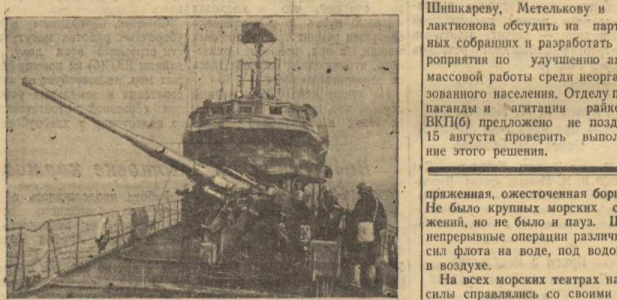
Черноморский флот. Из спянки: на палубе корабля.