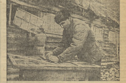
7. В предоктябрьском социалистическом соревновании не отстали от колхозников полеводческих бригад работники колхозных животноводческих ферм.

Животноводы подготовили скоту сытную и теплую заготовку обеспечили досрочное выполнение планов воспроизводства скота и повышения его продуктивности.