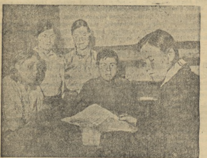
1. Визит хлеборобов Новосибирской области был встречен в колхозе имени Молотова новым подъемом трудовой активности. Колхоз включился в предоктябрьское социалистическое соревнование за досрочное выполнение годового плана хлебозаготовок и сдачу государству колхозами нашей области 300.000 пудов зерна сверх плана.

Колхозники заявили, что они полностью рассчитаются с государством к 29 октября — 28-летию ленинско-сталинского комсомола и в честь 29-й годовщины Великой Октябрьской социалистической революции сдадут государству 3.600 пудов хлеба сверх плана.