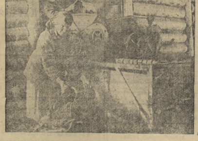
4. Электричество поставлено на службу сельскому хозяйству. Электрифицируются молотбы, полосу воды на колхозные фермы и ряд других производственных процессов.

На снимке: тов. Мерзлякова на дежурстве регулирует работу генератора.