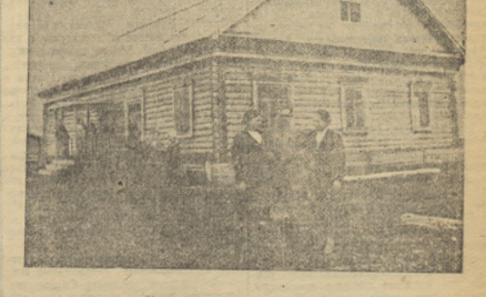
6. В новом колхозном клубе будут встречать члены колхоза 29-ю годовщину Великой Октябрьской социалистической революции. В этом помещении имеются большой зрительный зал, специальные комнаты для библиотеки, читальни, хаты-лаборатория. Участники драматического, хорового, музыкального кружка теперь имеют все возможности и лучшие условия для культурно-просветительной работы среди населения.

На снимке: зернохранилище колхоза, вмещающее 300 тонн семян зерна.