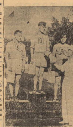
Фоте для мужчин на первом месте вышла команда Томского района, в малой эстафете для женщин — команда Пышкино-Троицкого района.