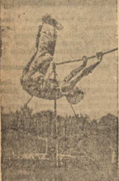
Выступления сильнейших гиревиков области, гимнастических упражнений детской спортивной школы и гимнастов томских высших учебных заведений в День физкультурника на стадионе «Медик»