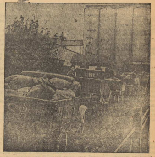
На снимке: автоволона с хлебом из колхозов Томского района пробили в элеватор.