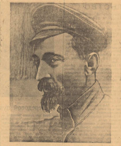
Феликс Эдмундович Дзержинский

В декабре 1917 года партия поставила Дзержинского на трудный пост председателя Всероссийской Чрезвычайной Комиссии по борьбе с контрреволюцией, саботажем и спекуляцией. На посту председателя ВЧК, а потом ОГПУ, бесценно и самоотверженно работал Дзержинский до последнего дня своей жизни. Он был непревзойденным оком рабочего класса, неутомимым и зорко следившим за всеми проявлениями врагов. Под его руководством были раскрыты и ликвидированы многочисленные контрреволюционные заговоры и востановления, организованные врагами народа при активной поддержке и участии преступников. Внутренний мир и спокойствие нашего государства, чем для Дзержинского отражались сталью рукой удара вра-