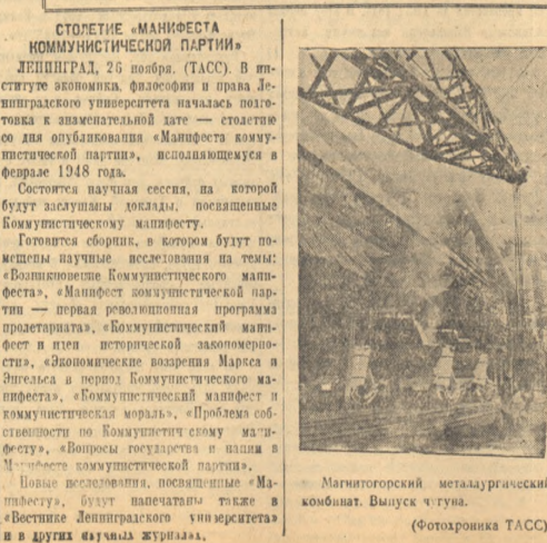
Магнитогорский металлургический комбинат. Выпуск чугуна. (Фотохроника ТАСС).