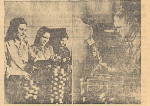
На заводах: трудящиеся завода и институтского.

Томский завод резиновой обуви производит обувь, которую можно обуть в любую погоду. Завод выпускает обувь, которую можно обуть в любую погоду. Завод выпускает обувь, которую можно обуть в любую погоду. Завод выпускает обувь, которую можно обуть в любую погоду.