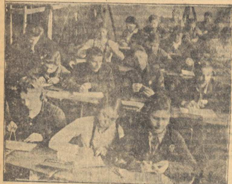
Студиям на занятиях.