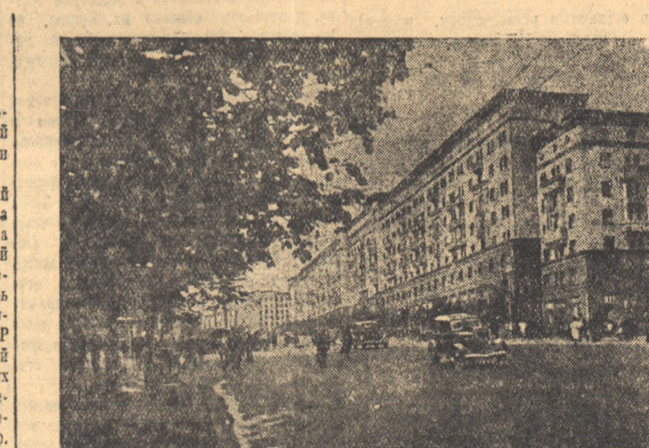
В Москве на площадях Сверлова, Революции и Советской, в Театральном проезде, а также на главной магистрали Москвы — улице Горького нынешней весной высажено более 300 миллионов лип. Все они с наступлением теплых весенних дней хорошо прижились.