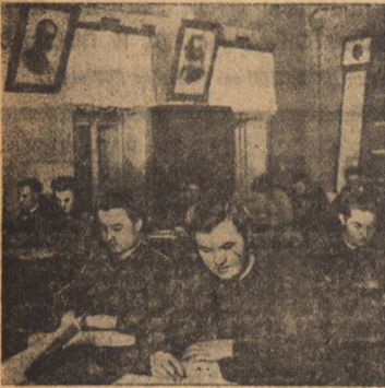
На снимке: студенты Томского электромеханического института инженеров ж.-д. транспорта в кабинете основ марксизма-ленинизма за самостоятельной работой над книгой.

(Из постановления ЦК ВКП(б) от 14 ноября 1933 года).