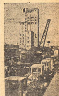
Атланский край. В городе Рубновске за годы Отечественной войны выросло крупное предприятие — Атланский тракторный завод, который уже дает стране тысячи тракторов. На снимке: погрузка тракторов на платформу.