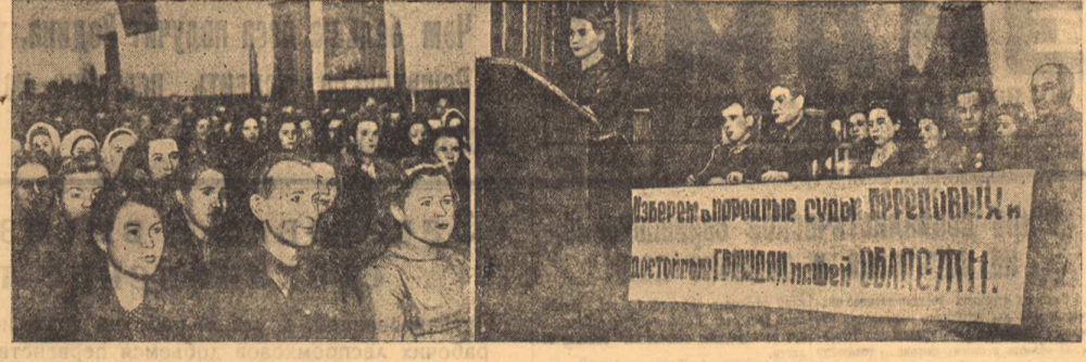
Подготовка к выборам народных судей. На снимке (слева): общий вид структурного предвыборного совещания 2-го избирательного округа Вокзального района; (справа) присутствие совещания.