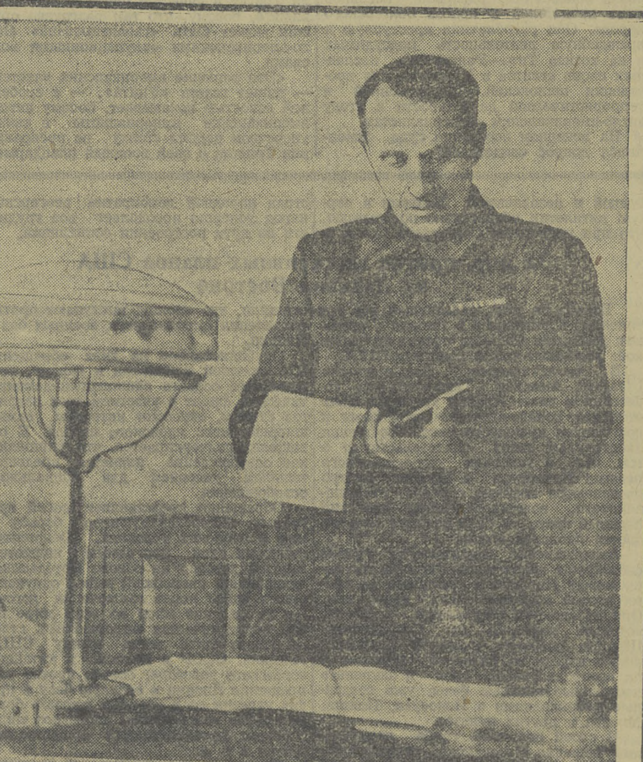
Лауреат Сталинской премии А. И. Цехановский.

● Плохо работает телефонная связь в Коженинском районе. Требуется немало времени, чтобы дозвониться до какой-либо организации. С 7 — 8 часов вечера только одна Ювалинская станция отвечает на вызовы, остальные молчат. Тов. Жинкину — начальнику конторы связи — необходимо улучшить в районе телефонную связь.