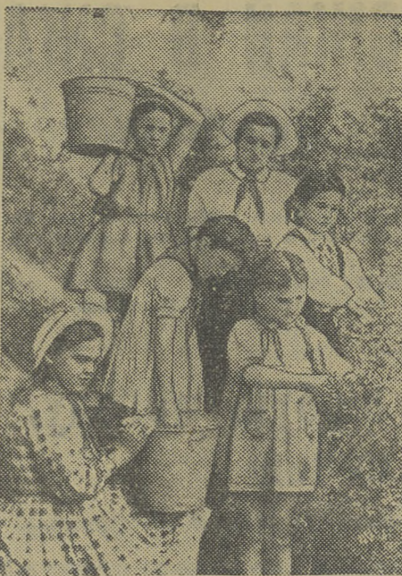
Пионеры и школьники, отдыхающие в пионерском лагере облпросвета на Басандайке, во время отдыха собрали более 1.100 килограммов стручков с семенами акации.