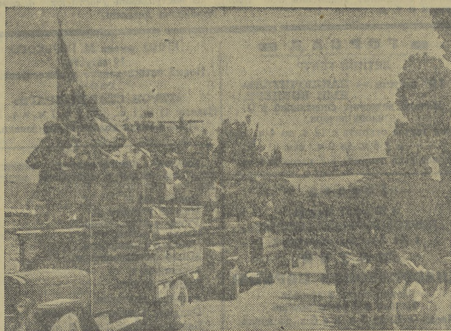
Узбекская ССР. Подписав Стокгольмское воззвание, хлеборобы Паркентского района, Ташкентской области, усиливают сдвиг хлеба государству. На снимке: красный обоз мира с зерном прибыл в районный центр — Паркент.

шей страны, своим стахановским трудом помогают крепить могущество нашей Родины. Поставив свои подписи под Стокгольмским воззванием, члены рыболовецкой бригады колхоза «17-я годовщина Октября», Баргасовского района, успешно несут вахту мира. Июльское задание по добыче рыбы ими выполнено на 179 процентов. По-стахановски трудятся бригады тов. Голешинки, рыбак тов. Колмаков. В августе они ловят рыбу сверх плана. Стахановскими делами отмечают вахту мира рыбаки колхозов имени Калининна, «2-я пятилетка», выполнявшие июльские задания по рыбодобыче на 175—185 процентов. В. НАДЕЖДИНСКИЙ.