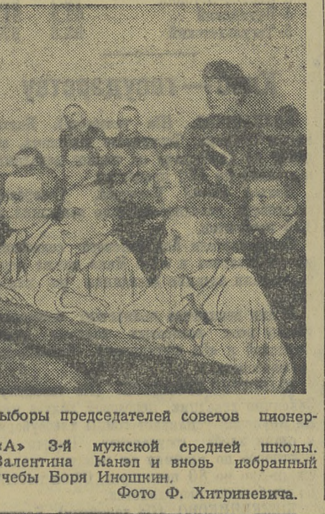
Во всех школах города проходят выборы председателей советов пионерских отрядов и звеньев.