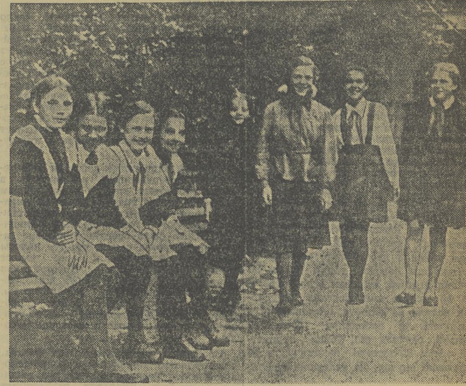
На снимке: ученицы женской средней школы № 1 в городском саду на празднике, посвященном началу учебного года.