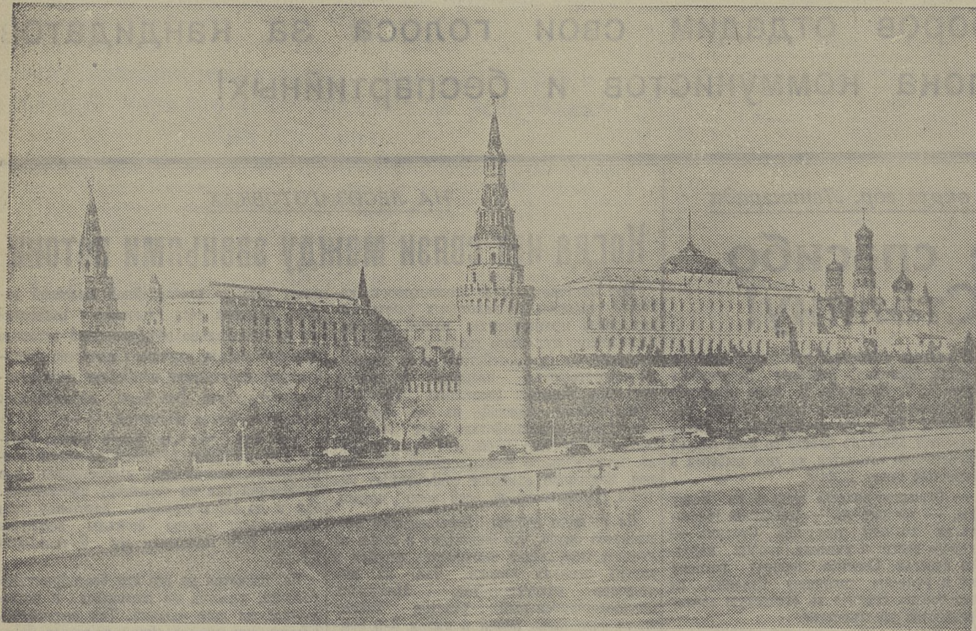
Москва — столица Союза Советских Социалистических Республик и Российской Федерации. В центре Москвы, на холме над рекой, стоит Кремль. Он окружен зубчатой стеной с высокими башнями. У стен Кремля лежат Красная площадь, на ней возвышается Мавзолей великого Ленина. В Москве, в Кремле, живет и работает Иосиф Виссарионович Сталин — величайший вождь советского народа и трудящихся всех стран. Москва — сердце нашей Родины. Вслед за Пушковым каждый из нас может сказать:

Москва... как много в этом звуке Для сердца русского слилось! Каждый из нас может повторить слова Лермонтова: Москва, Москва!... Люблю тебя, как сын, Как русский, — сильно, пламенно и нежно! Москва — политический, административный, культурный и промышленный центр Советского Союза. Москва — знаменосец новой, советской эпохи. На нее обращены взоры трудящихся всего мира. Москва — это символ освобождения всех народов от ярма капитализма. Москва — это глашатай мира во всем мире.