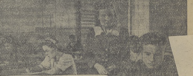
Количество учащихся в школах техникумах и других средних учебных заведениях нашей страны выросло за пятилетие на 8 миллионов человек и составило в 1950 году 37 миллионов.

Одновременно с подъемом материального положения народа в послевоенный период достигнут дальнейший расцвет культуры, науки и искусства.