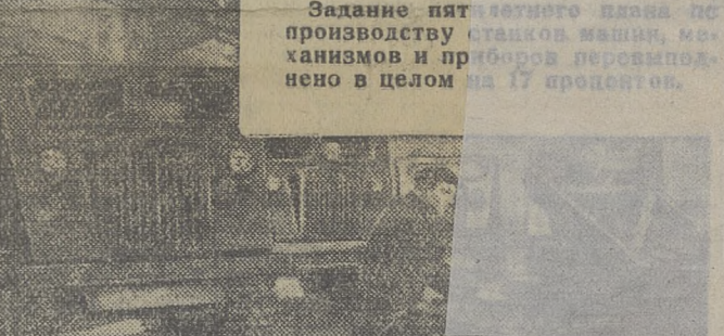
Машиностроение товарищ Сталин определил, как основной рычаг реконструкции народного хозяйства. Продукция машиностроения в 1950 году превзошла в 2,3 раза производство 1940 года.

Задание пятилетнего плана по производству станков, машин, механизмов и приборов перевыполнено в целом на 17 процентов.