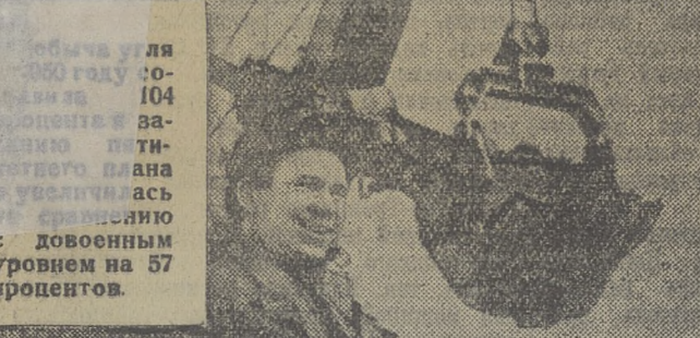
Объем добычи угля в 1950 году составил 104 миллиона тонн, что превышает задание пятилетнего плана на 17 процентов по сравнению с довоенным уровнем на 57 процентов.

Вновь возрождены к жизни гиганты советской металлургии — Запорожсталь, «Азовсталь», Днепровский завод Восстановлены Николаевский и Криворожский железорудные бассейны. Больших успехов добились металлургия Магнитогорск, Кузнецка. Построены и работают Убейский и Челябинский металлургические заводы.