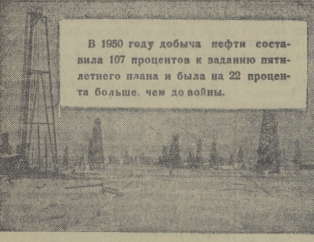
В «Записке о пятилетнем плане восстановления и развития народного хозяйства СССР на 1946—1950 гг.» было намечено добыть нефти в 1950 году до 35,4 миллиона тонн.

В 1950 году добыча нефти составила 107 процентов к заданию пятилетнего плана и была на 22 процента больше, чем до войны.