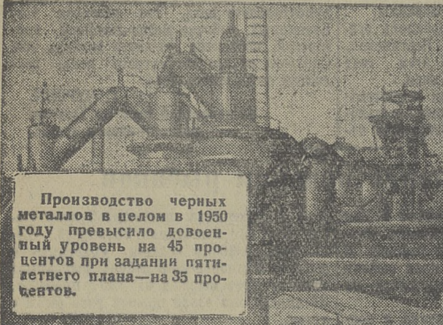
Производство черных металлов в целом в 1950 году превзошло довоенный уровень на 45 процентов при задании пятилетнего плана — на 35 процентов.

За годы пятилетки выросло и еще более окрепло общественное хозяйство колхозов, возросла материально-техническая база сельского хозяйства, повысилась роль машинно-тракторных станций в колхозном производстве, подготовлены новые квалифицированные кадры организаторов сельскохозяйственного производства, мастеров земледелия, животноводства и механизации.