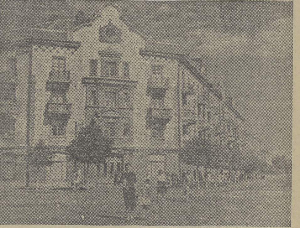
Украинская ССР. Новая улица имени Шевченко в городе Чернигове. (Фотохроника ТАСС).

подъемных механизмов для Волго-Донского судоходного канала. Теперь на этой стройке работает уже свыше двадцати таких кранов. Заов готовит к отправке еще одну большую партию кранов. Они будут отправлены строителям Южно-Украинского и Северо-Брянского каналов. 11 июля. (ТАСС).