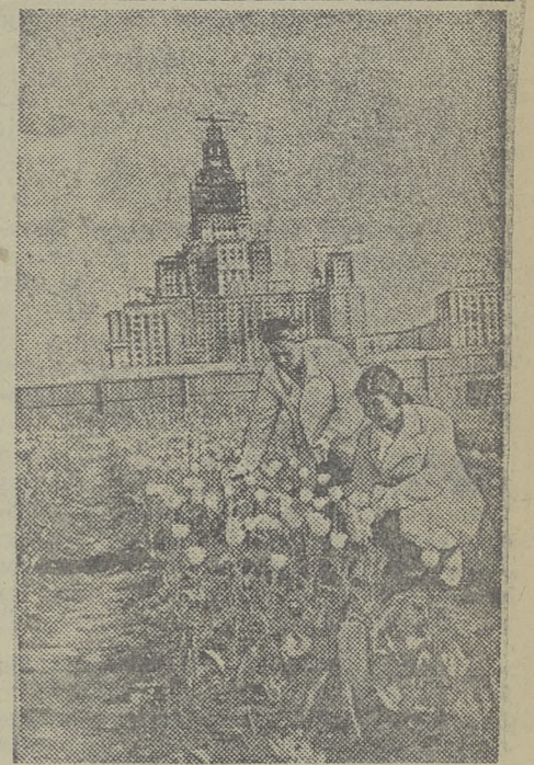
В Москве, на Ленинских горах, в западной части территории строительства Московского государственного университета, разбивается обширный агроботанический сад. Сюда ежедневно поступают семена со всех концов страны. С Дальнего Востока получены семена 250 разных пород деревьев, кустарников и многолетних трав. Всего будет высажено свыше 50 тысяч деревьев и кустарников, более 900 тысяч многолетних цветов и трав.

Речь Чу Ю на торжественном заседании, посвященном 24-й годовщине Пекино-освободительной армии Китая (3 стр.). За Пакт Мира (4 стр.). Хьюлетт Джонсон о своей поездке в Советский Союз (4 стр.). Присуждение члена Верховного суда США Дугласа (4 стр.). События в Коре (4 стр.). Зверская бомбардировка Хонгкяна американскими самолетами (4 стр.). Процесс руководителей шпионско-диверсионной организации, действовавшей в Войске Польском (4 стр.).