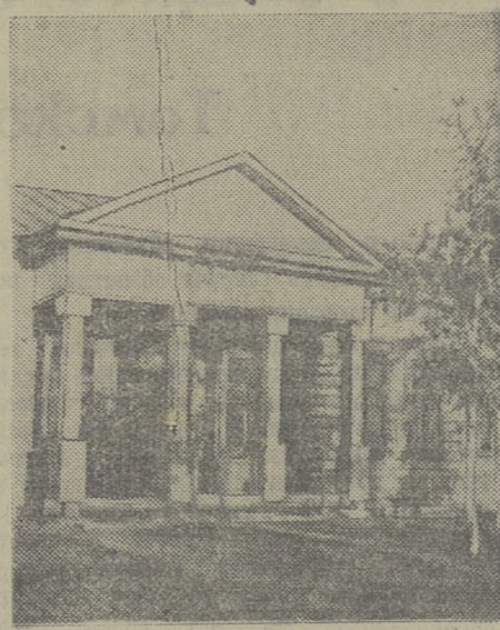
В районном центре села Шегарка заканчивается строительство здания районного Дома культуры. Сейчас ведут отделочные работы и монтаж парового отопления. На снимке: главный вход в районный Дом культуры.

К. ТРОФИМСКИЙ, заведующий отделом пропаганды и агитации Банчарского района ВКП(б).