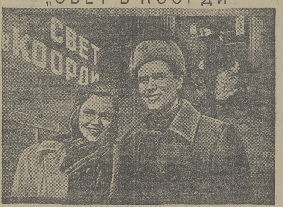
Сценарий лауреата Сталинской премии Г. ЛЕБЕРЕХТА, постановка лауреатов Сталинской премии Ю. ГЕРМАНА, Г. РАЙПОНОРТА и др. Производство ордена Ленина киностудии «Ленфильм». Выпуск «Главкинопроката» 1951 год.

Томская областная контора «Главкинопрокат» 5 ноября 1951 года выпускает на экраны города Томска и области новый художественный фильм