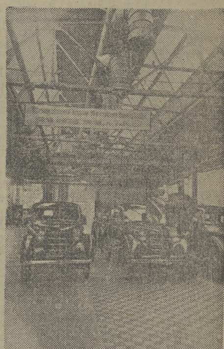
Коллектив Московского стахановского завода малолитражных автомобилей успешно выполняет предоктябрьские социалистические обязательства. 1.400 стахановцев уже завершили годовые задания и сейчас работают в счет 1952 года. На снимке: в цехе сдачи готовых автомобилей. (Фотохроника ТАСС).