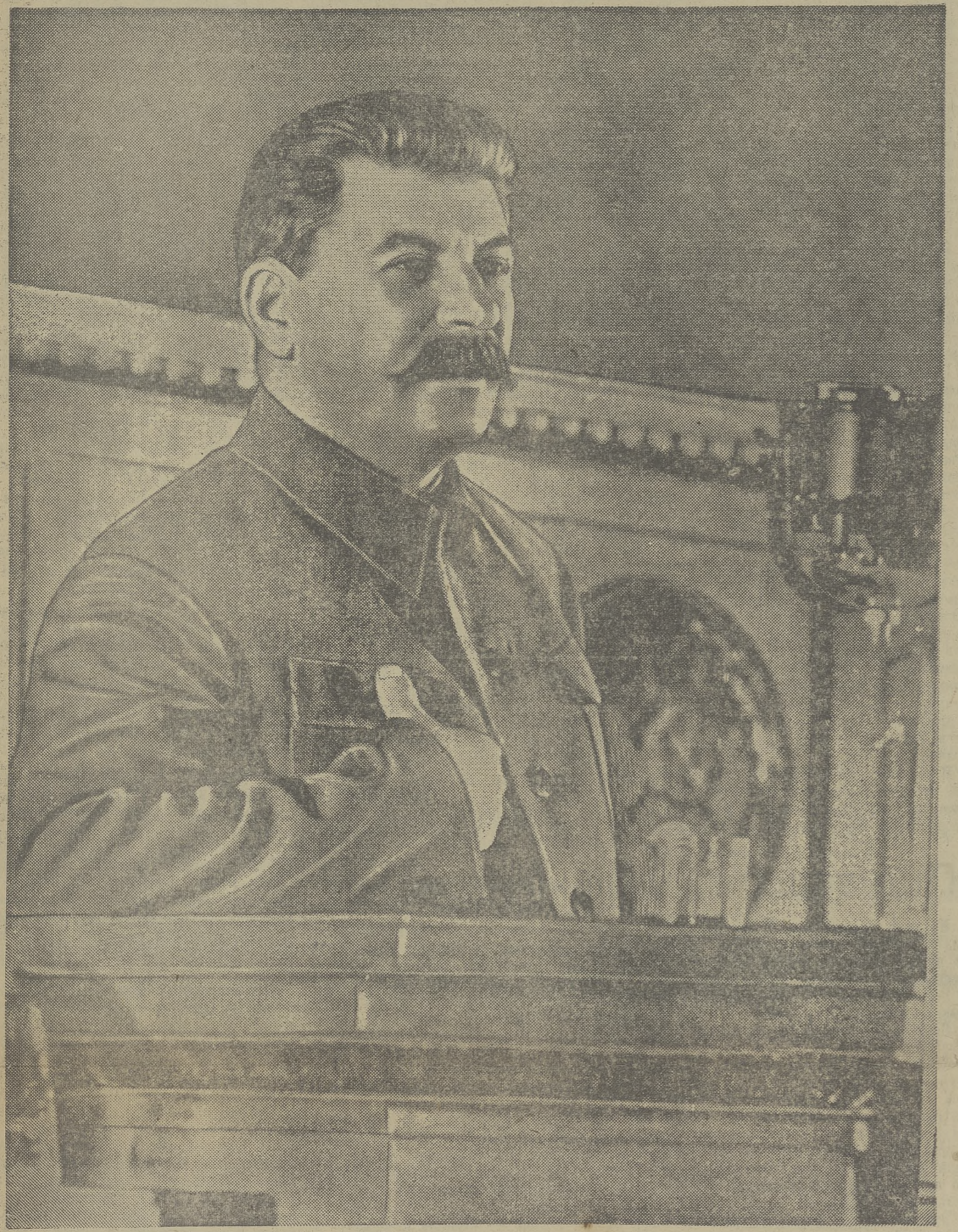
Товарищ И. В. СТАЛИН на трибуне Чрезвычайного VIII Всесоюзного съезда Советов

Да здравствует творец Сталинской Конституции, великий вождь трудящихся, знаменосец мира товарищ Сталин!