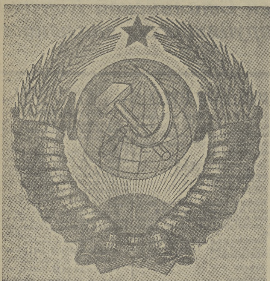
Государственный герб Союза Советских Социалистических республик

Союз нерушимый республик свободных Сплотила навеки Великая Русь. Да здравствует созданный волей народов, Единый, могучий Советский Союз!