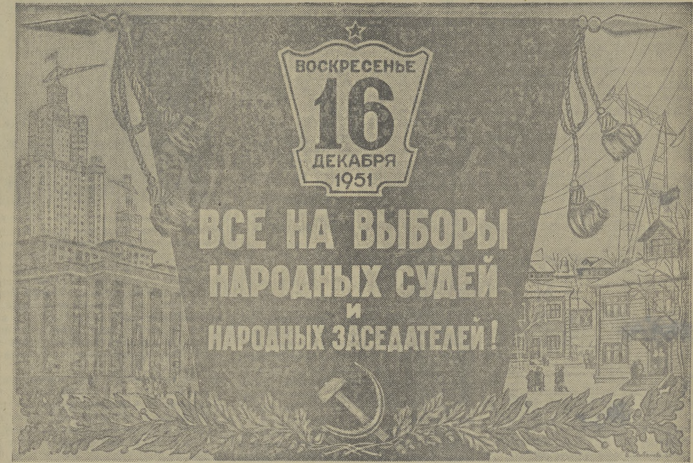
Плакат работы художника В. Ливава, выпущенный Государственным издательством «Искусство».

Г. ЧУРСИН, рабровский пост газеты «Красное Знамя» на подпунктовом заводе.