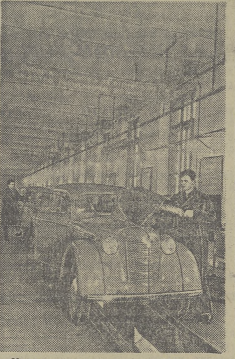
Коллектив стахановского Московского завода малолитражных автомобилей досрочно выполнил годовой план. На снимке: на поточной линии окончателной отделки машин. (Фотохроника ТАСС).

Передовые коллективы приступили к составлению стахановских планов труда в 1952 году. В этой работе, рассчитанной на полное использование резервов хозяйства, участвуют лучшие производственники и инженерно-технические работники. (ТАСС).