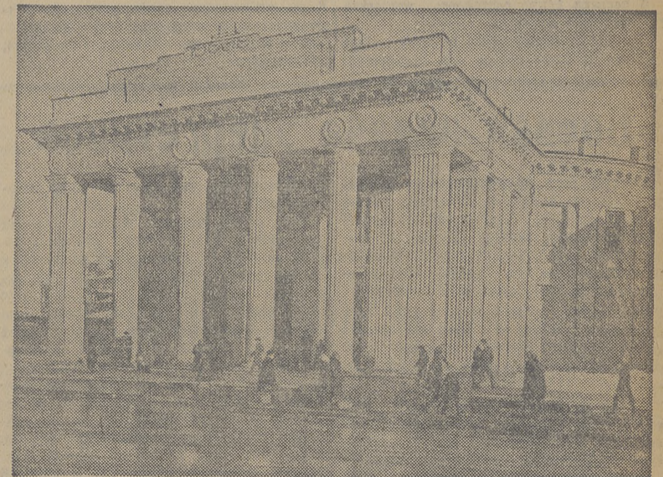
Наружный вестибюль станции «Новослободская» новой линии Большого кольца Московского метрополитена.

Внедрение начинания позволило коллективу завода сэкономить в январе инструментов на 80 тысяч рублей.