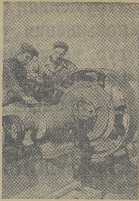
На Томском кирпичном заводе № 10 идут подготовительные работы и легкому сезону. Цехи оснащаются передовой современной техникой...