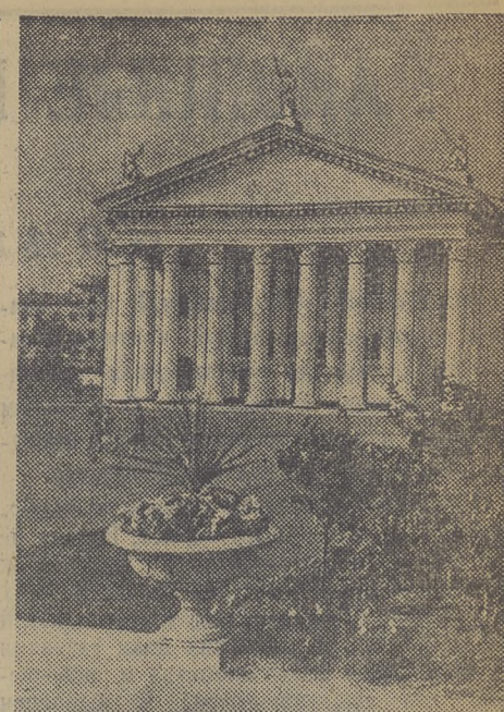
Сталинград. Восстановленное и реконструированное здание областного драматического театра имени М. Горького на площади Павших борцов.

Долг партийных организаций — шире развернуть социалистическое соревнование за досрочное выполнение плана заготовки кормов.