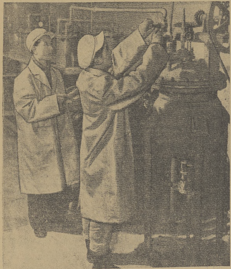
Китайская Народная Республика. В центральной лаборатории Шанхайского химического завода создан новый материал для изготовления пластмасс. Работники лаборатории получили поливинилхлорид из спирта. На предприятии налажено опытное производство этого материала. На снимке: в опытном цехе. (Агентство Синьхуа).

Газета пишет, что это уже не первый случай, когда американские военнослужащие стреляют по ливийцам. «Аль-либий» подчеркивает, что и на этот раз преступник не понесет никакой ответственности, так как, по условиям соглашения, заключенного между США и Ливией в 1954 году, личный состав вооруженных сил США в Ливии не подлежит юрисдикции местных судов.