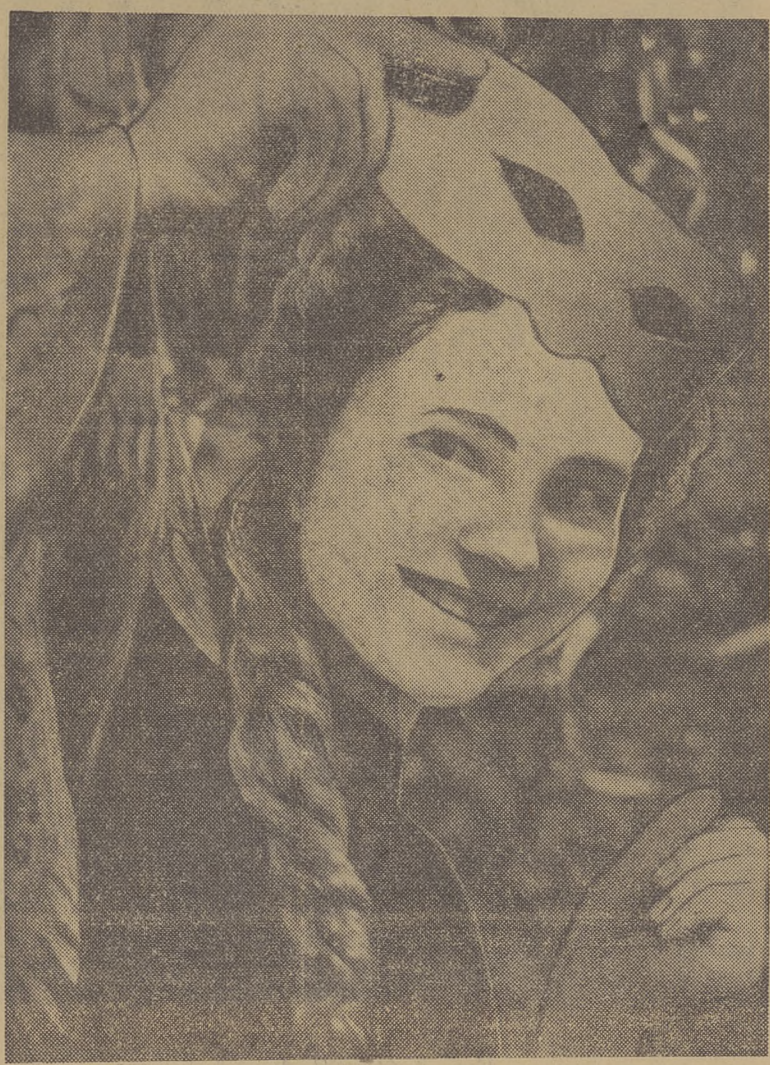
НА НОВОГОДНЕМ БАЛУ