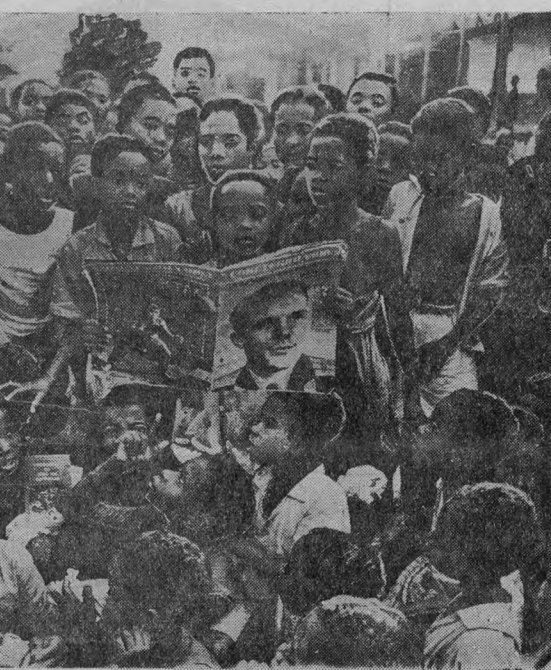
РЕСПУБЛИКА ГАНА. Школьники поселка Аманокрум с большим интересом рассматривают журнал «Советский Союз».

19 июля — «Полосатый рейс». Сеансы: 4, 6, 8, 10.