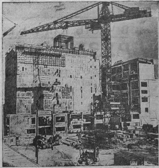
На снимке: на строительной площадке. (Фотохроника ТАСС).

СВЕРДЛОВСКАЯ ОБЛ. ЛАСТЬ. Строители Белоярской атомной электростанции успешно справились с возведением здания реакторного отделения. Сейчас здесь ведутся отделочные работы. Коллектив строителей борется за досрочную сдачу в эксплуатацию первой очереди станции.