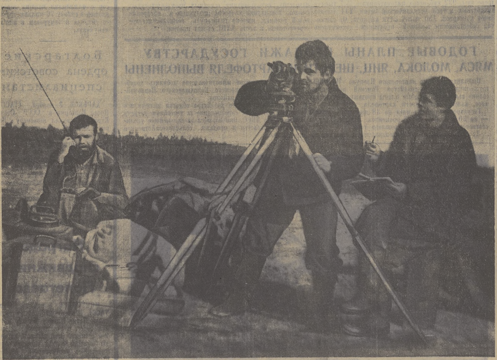
Позвала беспокойных романтика...