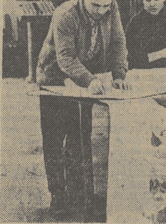
ЦЕХ ПРИМЕРЯЕТ ПРАЗДНИЧНОЕ ПЛАТЬЕ.

...С каждым днем все наряднее, все праздничнее становится наши улицы. По-новому выглядят привычные дома цент-