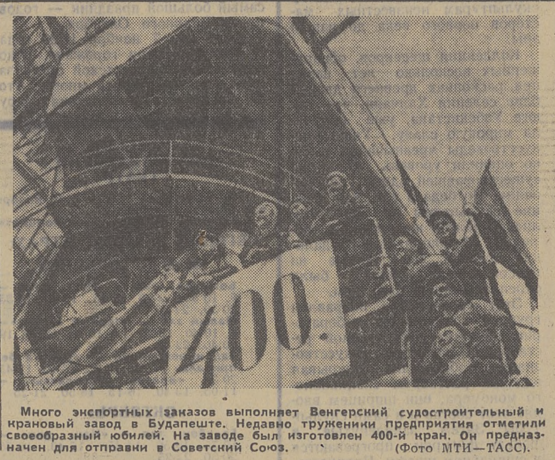
Много экспортных заказов выполняет Венгерский судостроительный и ирригационный завод в Будапеште. Недавно трудящиеся предприятия отметили своеобразный юбилей. На заводе был изготовлен 400-й кран. Он предназначен для отправки в Советский Союз.