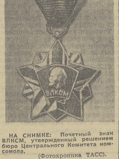
НА СНИМКЕ: Почетный знак ВЛКСМ, утвержденный решением бюро Центрального Комитета комсомола.

Представители коммунистических союзов молодежи, молодежных организаций, выступившие с приветствиями советской молодежи, вручили XV съезду ВЛКСМ знамена своих организаций, памятные подарки. На этом вечернее заседание съезда закончилось. Большой концерт, посвященный юности, ее героическим делам, был дан в Кремлевском Дворце съездов делегатам и гостям съезда. Он выпался в яркий праздник советского искусства.