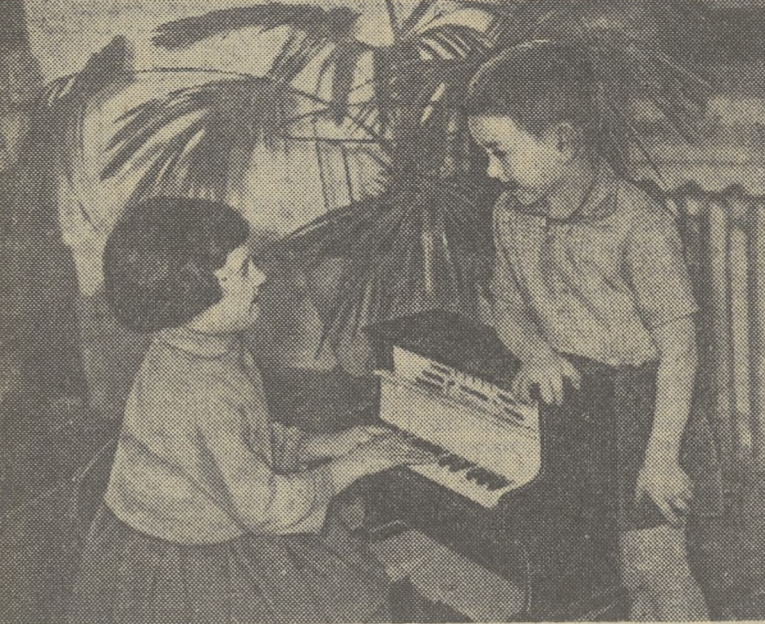
БЫЛО ЕЙ ЧЕТЫРЕ ГОДА. БЫЛО ПЯТЬ ЕМУ...

Зам. редактора Е. М. ШАТОХИН. СЛЕДУЮЩИЙ НОМЕР ГАЗЕТЫ ВЫЙДЕТ 3 ИЮНЯ С. Г.