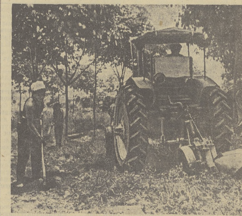
ДЕМОКРАТИЧЕСКАЯ РЕПУБЛИКА ВЬЕТНАМ. Работники государственного хозяйства Куэт Чанг провинции Виньминь в тяжелых условиях расширяют плантации риса.