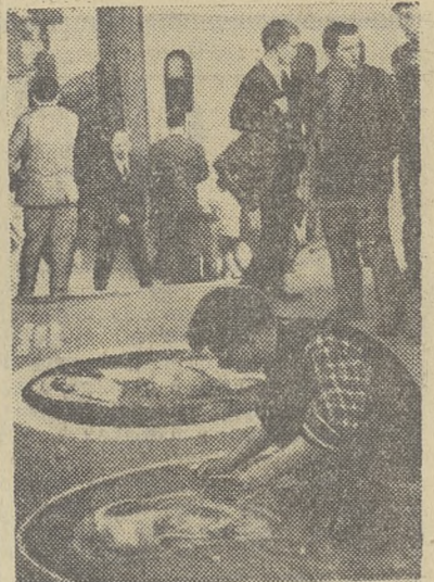
ВЕНЕЦИЯ. Асфальт «прекрасного города», по мнению местных художников, — наиболее подходящее место для уржаний в живописи. Брошечный художник за какой-нибудь час набросал конию «Мадонны» и портрет национального героя Джузеппе Гарибальди. Наутро чистилася стирала эти произведения искусства, давая новый простор для творческой фантазии «свободного художника».

зыканты электромеханического завода. Хорошие программы показали эстрадные оркестры ТПИ и ТГУ. Среди тематических концертов жюри отметило как лучшие программу политехнического «С песней по жизни» и их же театр теней, а также концерт тмазовцев «Трудом своим построим коммунизм». Лучшими агитбригадами были признаны бригады ТЭМЗа и ТИСИ. В общем итоге среди вузовских коллективов первое место поделили два коллектива — университет и политехнический институт. Среди предприятий победителем смотра оказался электромеханический завод, полностью выполнивший всю жанровую программу смотра. Б. СЕРГЕЕВ.