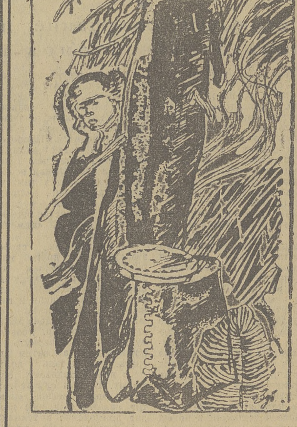
Редактор А. П. НОВОСЕЛОВ.

С 18 сентября на экранах города демонстрируется кинокомедия