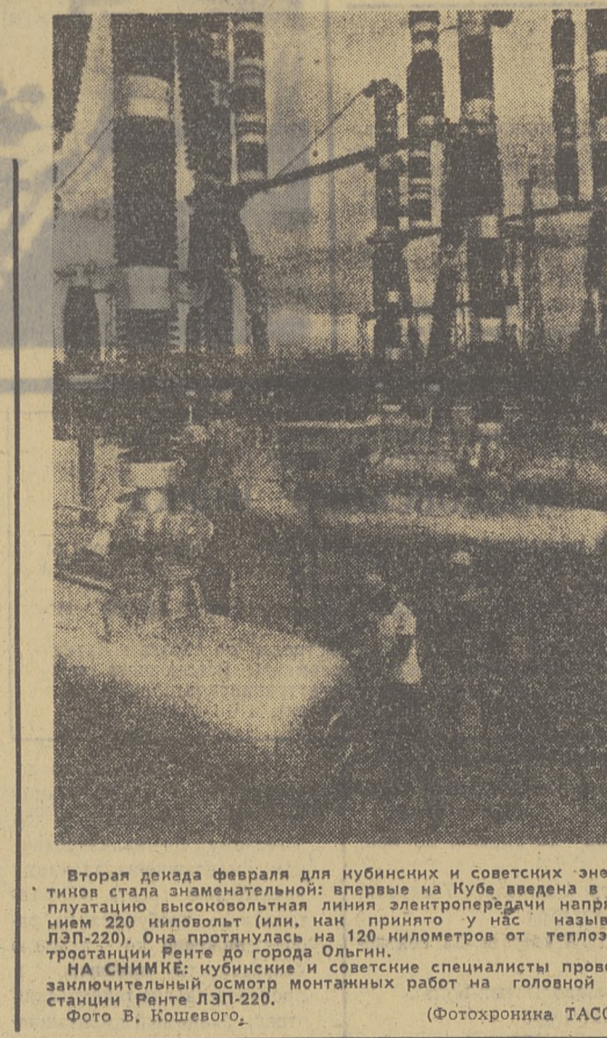
Вторая декада февраля для кубинских и советских энергетиков стала знаменательной: впервые на Кубе введена в эксплуатацию высоковольтная линия электропередачи напряжением 220 киловольт (или, как принято у нас называть, ЭП-220). Она протянулась на 120 километров от теплостанции Ренте до города Ольгин. На СНИИМЕ кубинские и советские специалисты проводят заключительный осмотр монтажных работ на головной подстанции Ренте ДЭ-220.