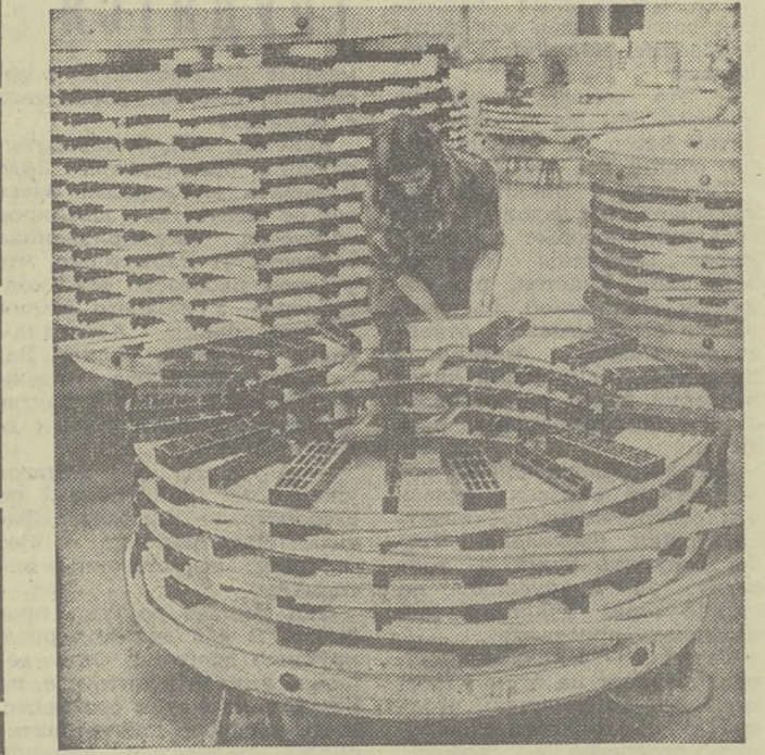
ЭКОНОМИЧЕСКОЕ СОТРУДНИЧЕСТВО В РАМКАХ СЭВ ВЕНЕРИЙ. Трансформаторный завод Челябинского комбината специализируется на производстве выключателей для линий высоковольтной электропередачи. Эта аппаратура экспортируется в социалистические страны.